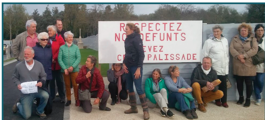
(article du 3.11.2022)